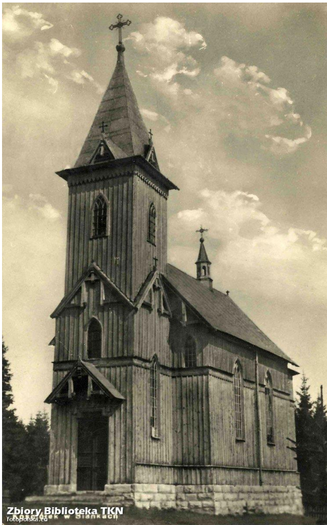
Ryc. 6. Sianki. Kościół rzymskokatolicki z 1905 r.