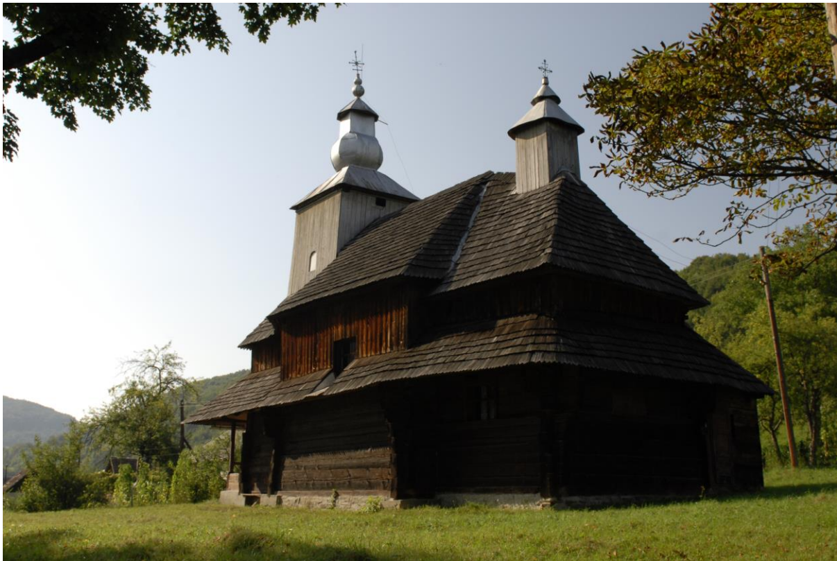
Fot. 2. Sil (Użański PN - Ukraina) – cerkiew 1793 r. przeniesiona z Sianek (fot. G. Holly, 2012).