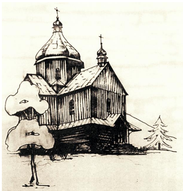
Ryc. 3. Sianki. Cerkiew greckokatolicka z 1906 r.