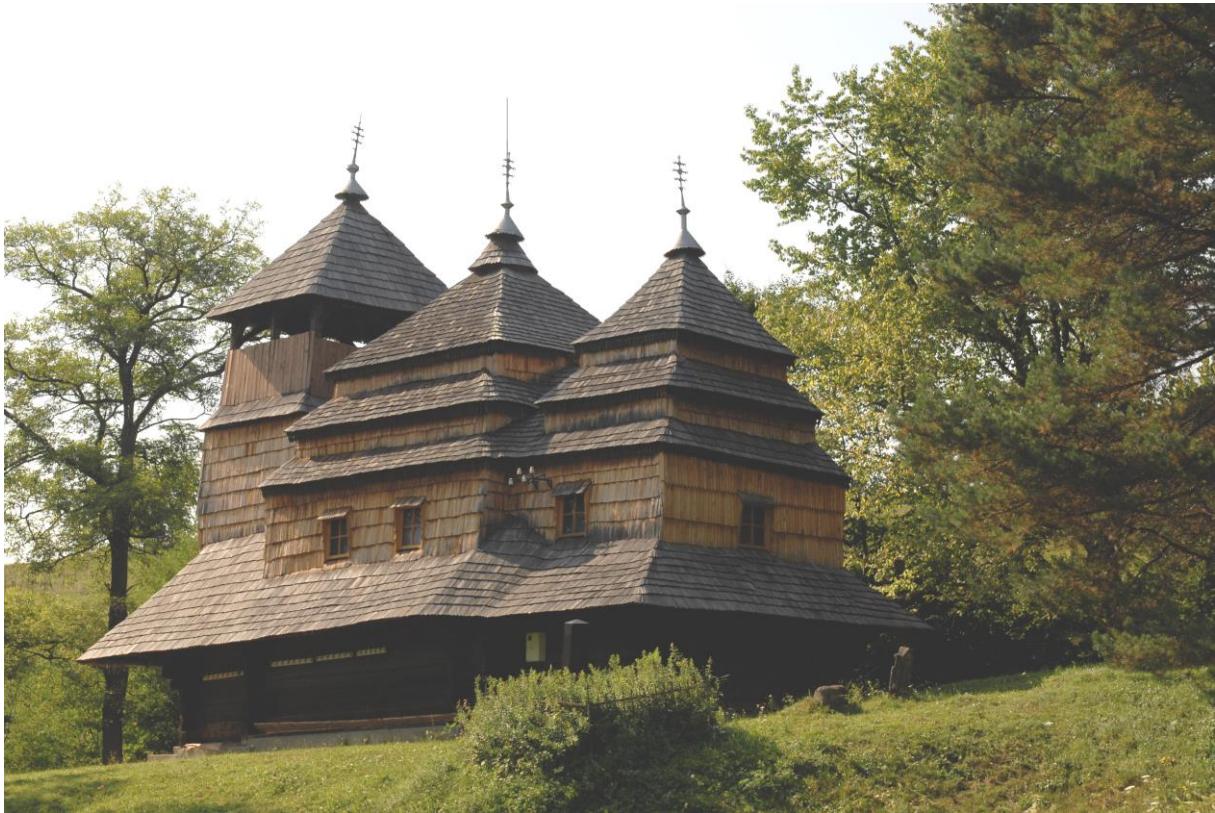
Fot. 1. Kostrino (Użański PN) - cerkiew z 1703 r. przeniesiona z Sianek.