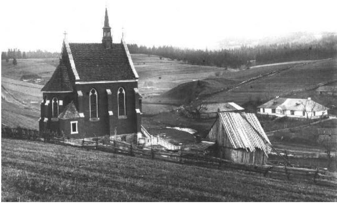
Ryc. 5. Sianki. Kaplica dworska Stroińskich.