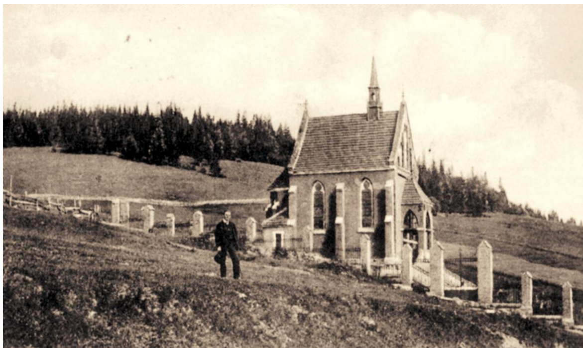
Ryc. 4. Sianki. Kaplica dworska Stroińskich.