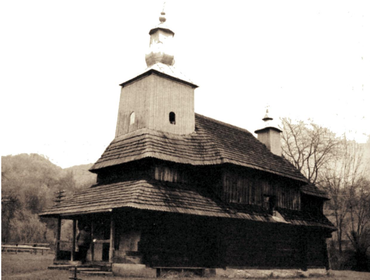
Ryc. 2. Sianki. Cerkiew greckokatolicka z 1793 r., obecnie w miejscowości Sil na Ukrainie (ok. 1970 r.).